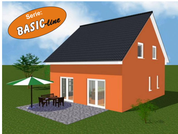
Abbildungen teilweise mit Sonderausstattung